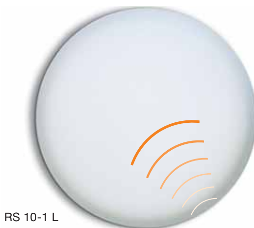
RS 10-1 L