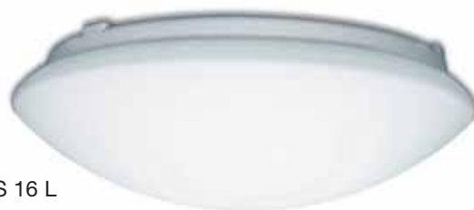
RS 16 L